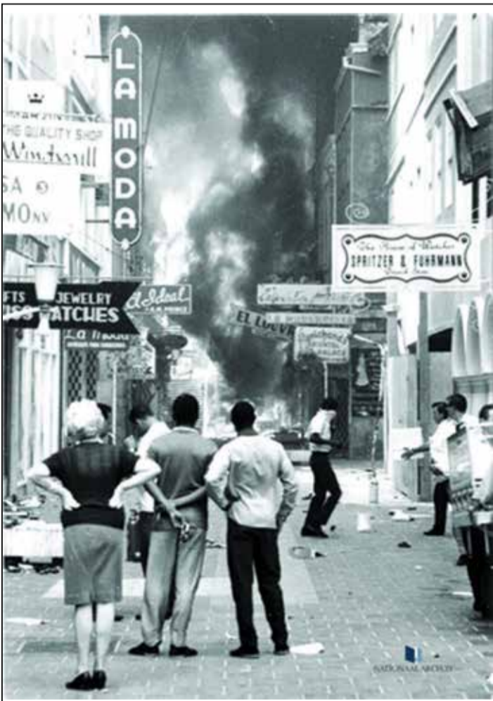
AFBW a sigui e susesonan di 30 di mei ku atenshon.